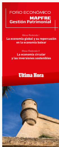
Cartell entrada. 45 x 120 cm