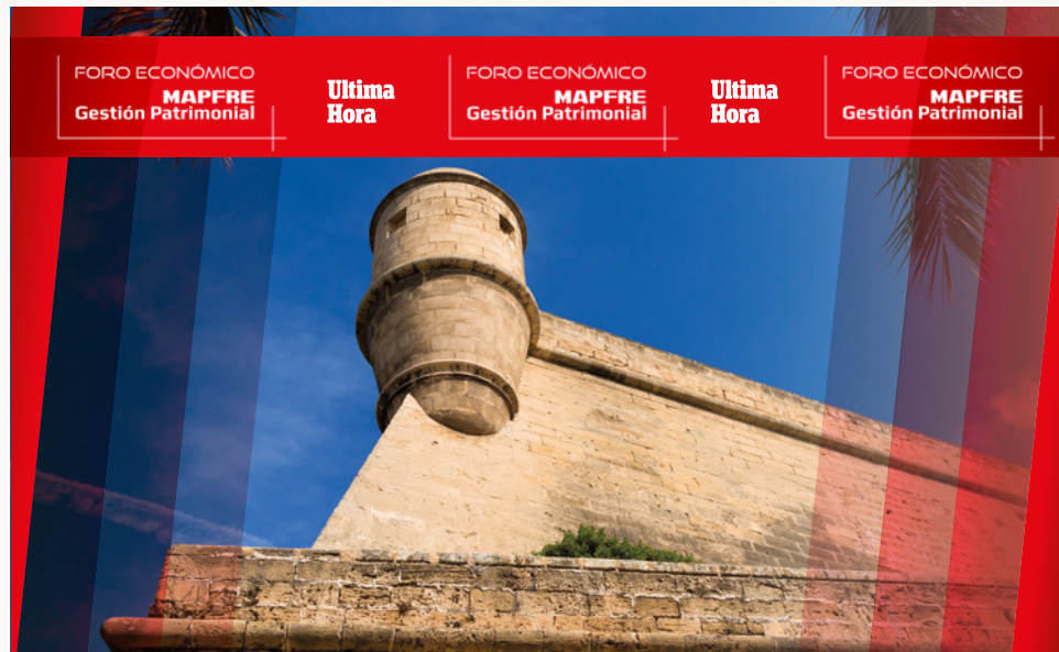
Photocall. 376 x 226 cm