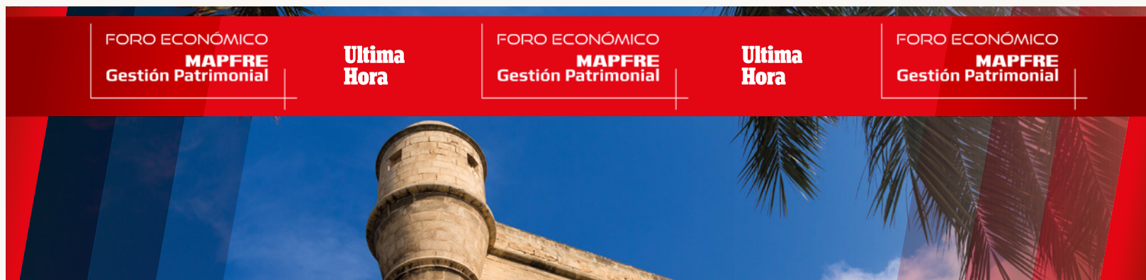
600 x 152 cm